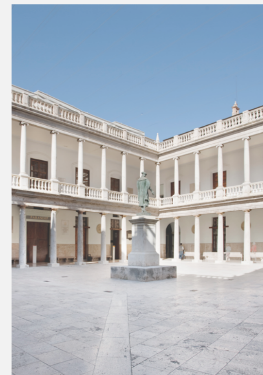
Claustro del edificio de la Nau