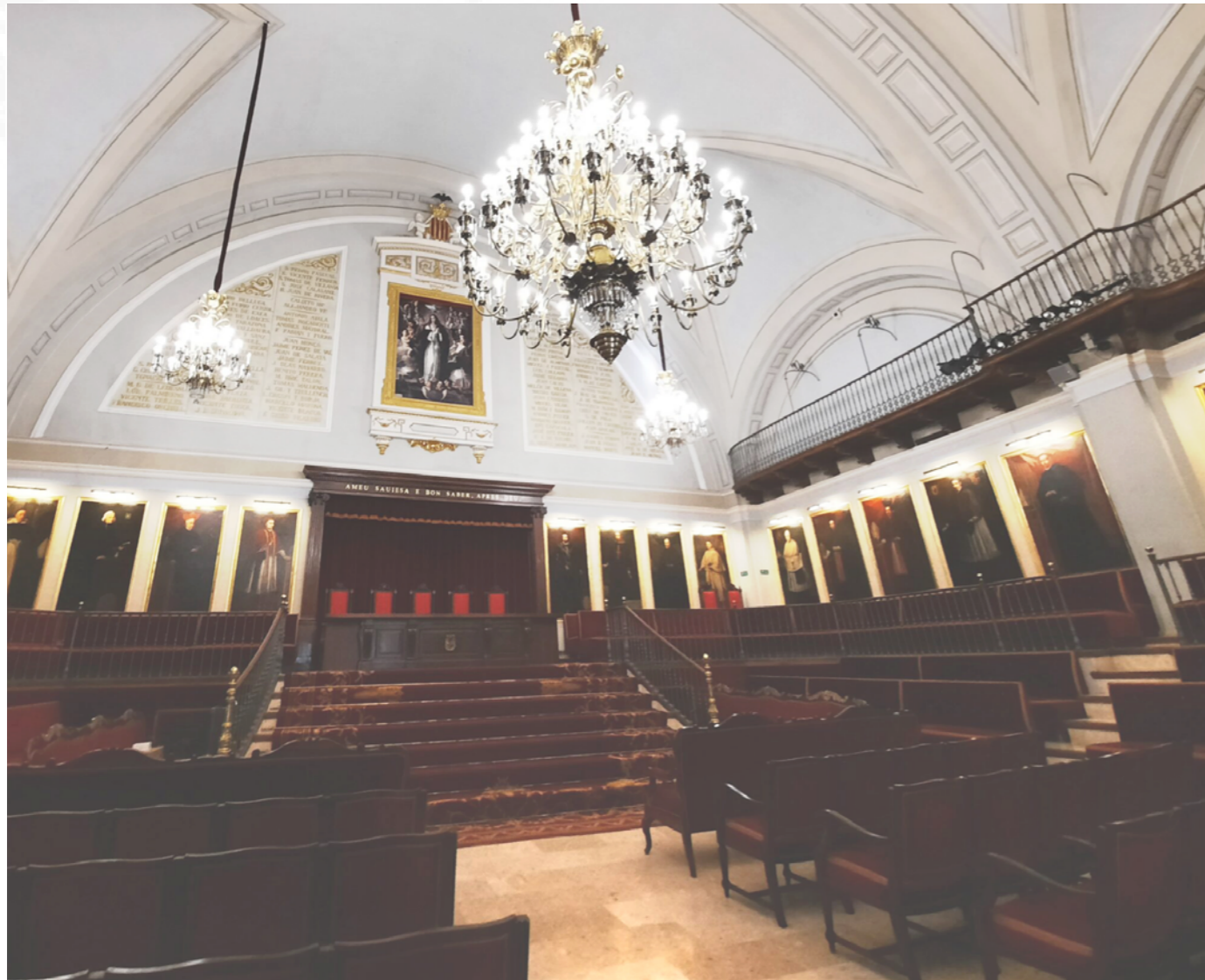
Paraninfo de la Universitat. Edificio de La Nau