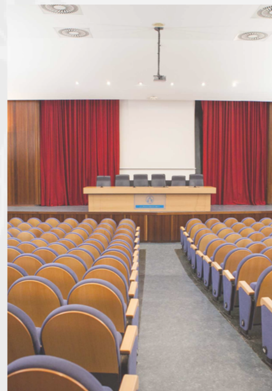
Salón de Actos Joan Fuster