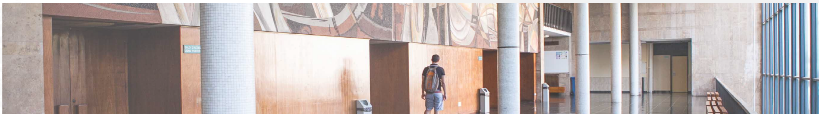
Salón de Actos Joan Fuster